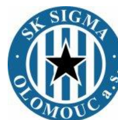
SK SIGMA OLOMOUC