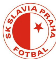
SK SLAVIA PRAHA