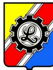
UKS LECHIA DZIERONIOW (PL)