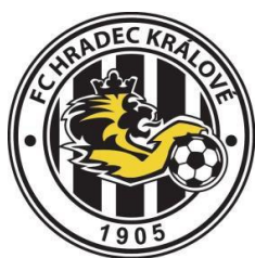
FC HRADEC KRÁLOVÉ